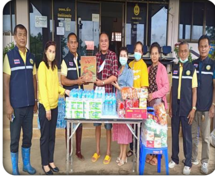
วงอบคุณทุกท่านที่ได้ให้ความช่วยเหลือกับผู้ประสบภัยน้ำท่วม