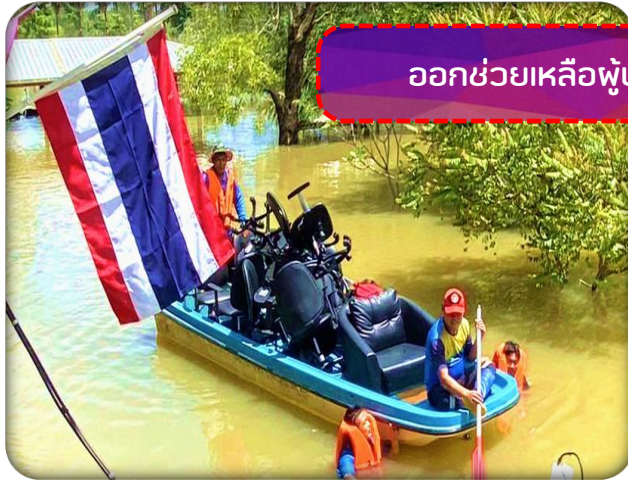
ออกช่วยเหลือผู้ประสบภัยน้ำท่วม